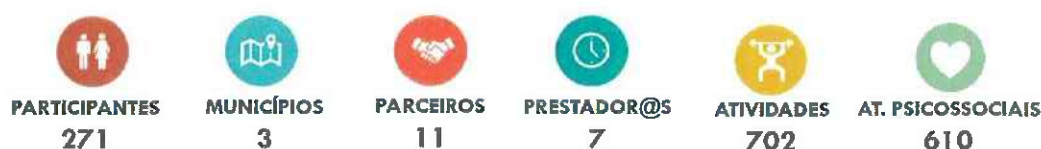
Figura 1 – Os números do Projeto Saúde Mental 360º Algarve (Dez. 24).

De salientar que o nível de adesão às atividades tem sido bastante elevado, e que o projeto continua a ser bem acolhido pelos parceiros, pela comunidade e pelos participantes que têm vindo gradualmente a envolver-se entusiasticamente nas atividades, esclarecendo dúvidas, desmistificando conceitos e preconceitos sobre doença mental e melhorando a sua forma de estar no dia-a-dia.