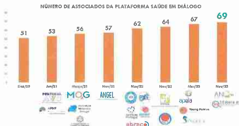
Gráfico 1 – Evolução do número de associadas da Plataforma Saúde em Diálogo