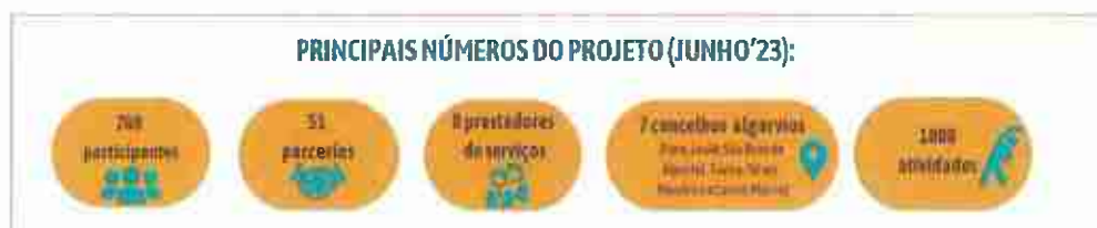
Figura 1- Principais números do Projeto ES360° Algarve

Através de uma abordagem de proximidade, centrada nas necessidades do cidadão e assente em parcerias e colaborações locais em sete concelhos algarvios, o projeto propôs-se a melhorar a qualidade de vida de, pelo menos, 500 idosos do Algarve. Ao longo de dois anos e meio, os beneficiários, cidadãos com mais de 65 anos, fracos recursos económicos e baixa escolaridade, foram acompanhados de perto pela equipa de projeto, tendo participado ativamente em diversas atividades, dinamizadas por uma equipa multidisciplinar, entre as quais: sessões informativas sobre saúde e prevenção da doença, workshops de nutrição, sessões de navegação no sistema de saúde, atividade física adaptada, sessões de Yoga e exercícios de estimulação cognitiva, encontros com associações de doentes, atendimentos psicossociais e sessões sobre literacia na área do medicamento/revisão da medicação, em parceria com as farmácias locais. (Figura 1)